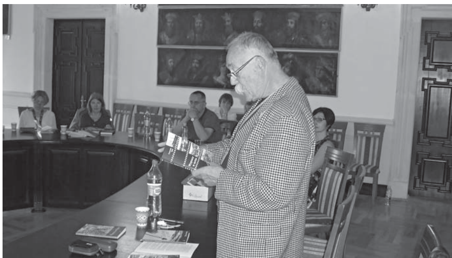
Zbaraż. Eliptyczny stół w sali hetmańskiej na zamku, gdzie odbywało się sympozjum literackie Dialogu Dwóch Kultur w 2019 r.

skich Polskiego Związku Motorowodnego i Narciarstwa Wodnego (kadencja 2003–2007) oraz ds. śródlądowych (kadencja 2011–2015 i 2015–2019). Od 2019 roku jest Prezesem Polskiego Związku Motorowodnego i Narciarstwa Wodnego. Członek Komisji Kultury i Wydawnictw Polskiego Związku Żeglarskiego (2007–2013). Autor m.in. podręczników: Vademecum żeglarza i sternika jachtowego (2002) wzniesionego w 2003 i 2004 roku w pięknej szacie graficznej i uznanego za jeden z najlepszych podręczników żeglarskich wydanych w ostatnich latach w Polsce oraz Vademecum sternika i starszego sternika motorowodnego , również uznanego za jedną z najlepszych publikacji do nauki jachtingu motorowego. Następny podręcznik to Vademecum nauczyciela żeglarstwa zalecany przez Polski Związek Żeglarski.